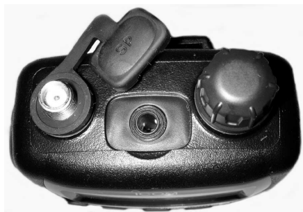
Oberseite mit SMA-Antennenbuchse.

Das Laden kann in einem bereits vorhandenen Ladegerät erfolgen oder mit dem beiliegenden Steckernetzgerät, das mit einer Stromabgabe bis zu 1 A auch gleichzeitigen Betrieb und Laden erlaubt. Vorbildlich: Ein im Scanner eingebauter Timer begrenzt die Ladezeit auf maximal fünfzehn Stunden. Um das Laden von Primärbatterien zu vermeiden, erkennt der Scanner das Auswechseln von Batterien automatisch. Zusammen mit einer wählbaren automatischen Abschaltung nach 30 bis 120 Minuten ohne Bedienung und einer selbst anpassenden Stromsparschaltung für den Standbybetrieb ist die Stromversorgung komplett. Für den Mobilbetrieb gibt es einen optionalen 6-V-Adapter für den Zigarettenanzünder.