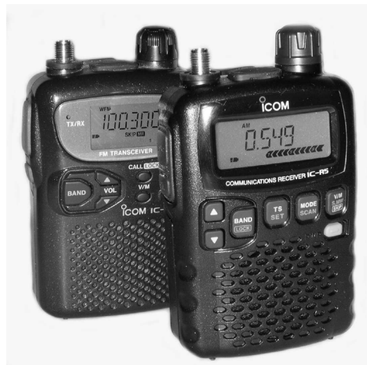
Der IC-R5 (rechts) und sein Vorgänger IC-R2. Der Neue hat nun auch einen Netz- und Ladesteckanschluss und ist leichter zu bedienen.

Um in allen Frequenzbereichen optimale Empfindlichkeit zu erzielen, kann auch hier nur wieder zu einer ausziehbaren Teleskopantenne geraten werden, ggf. mit einem passenden Antennenadapter.