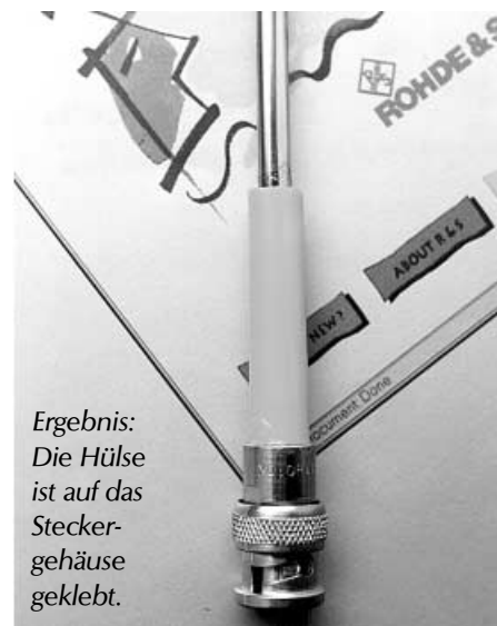
Ergebnis: Die Hülse ist auf das Steckergehäuse geklebt.

Geld gespart und Umwelt entlastet – so macht das Basteln Spaß.