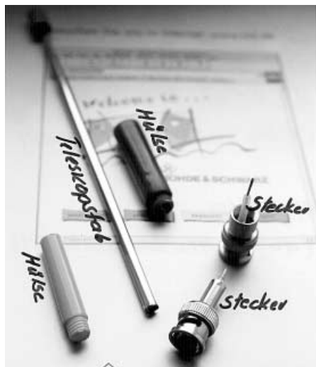
Überblick: die notwendigen Bauteile.

Wer besonders geschickt ist, bemißt die Länge so, daß sie in eingeschobenem Zustand etwa 17 cm beträgt und ausgeschoben etwa 47 cm, denn dann ist die Antenne auch zum Senden zu gebrauchen (leider nicht gleichzeitig), wobei diese auf 70 cm eingeschoben bzw. auf 2 m ausgeschoben wird. Hierbei arbeitet diese als \lambda/4 -Antenne. Wer noch eine Verbesserung erreichen möchte, kann ein so-