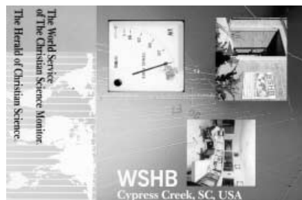
Diese Karte stammt aus den USA.

Einigen Rundfunksendern reicht auch die Angabe S I O. Ein SINPO könnte also beispielsweise sein 5 4 5 4 4, wobei der