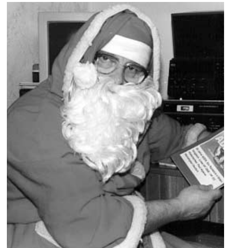
Mancher freut sich wie zu Weihnachten, wenn der Postmann wieder mal eine QSL-Karte eingeworfen hat.

0-Wert nicht höher sein kann, als der niedrigste Wert von S I N P.